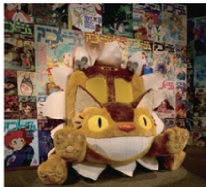
エントランス：ネコバス (フォトロケーション)